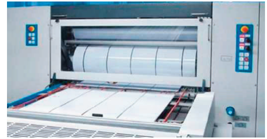
Rodillo mylander con "reservas"

El recubrimiento de los rodillos juega un papel muy importante en la transformación de la lámina de metal y posteriores procesos de lacado y barnizado de la fabricación de los envases metálicos consumidos en alimentación, bebidas, aerosoles, botes industriales, etc. Gomplast ofrece soluciones de alto rendimiento para todas estas aplicaciones.